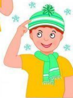
Na hlavu — prstem ukážeme na hlavu.

Chumelí — ruce s nataženými prsty dáme před sebe a jejich mírným pohybem napodobíme padání vloček.