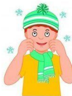
Štípe mráz — štípeme se do tváří.

Už je tady zima zas, do tváří nás štípe mráz . Venku sněží, chumelí , nezůstanem v posteli. Budeme si venku hrát, lyžovat a sáňkovat. Venku snížek padá, na hlavu i záda .